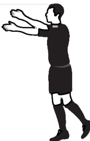
Obr.8 Výhoda (PVK)