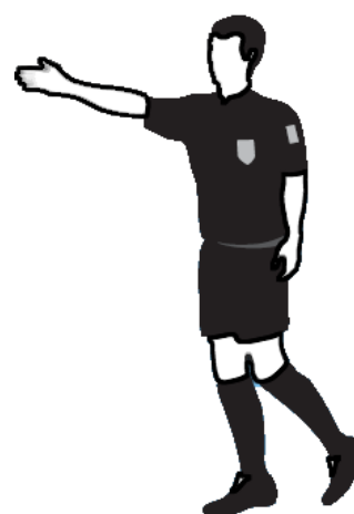
Obr.8 Výhoda (NVK)