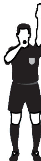
Obr.3 Nepřímý volný kop