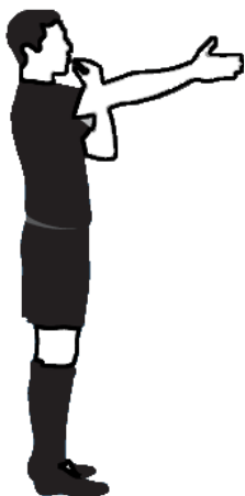
Obr.1 Zahájení hry