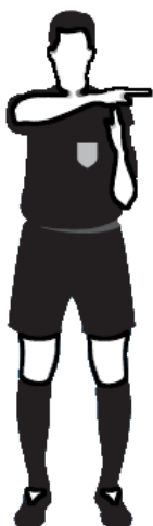
Obr.13 Oddechový čas.