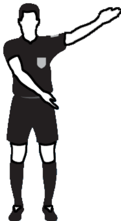
Obr.2 Přímý volný kop