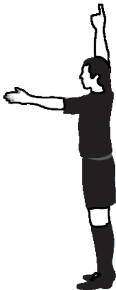
Obr.11 Akumulovaný faul (2)