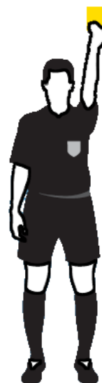
Obr.12 Udělení osobního trestu