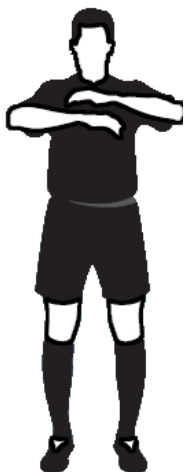
Obr.10 Akumulovaný faul (1)