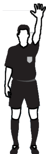
Obr.7 Pátý akumulovaný faul