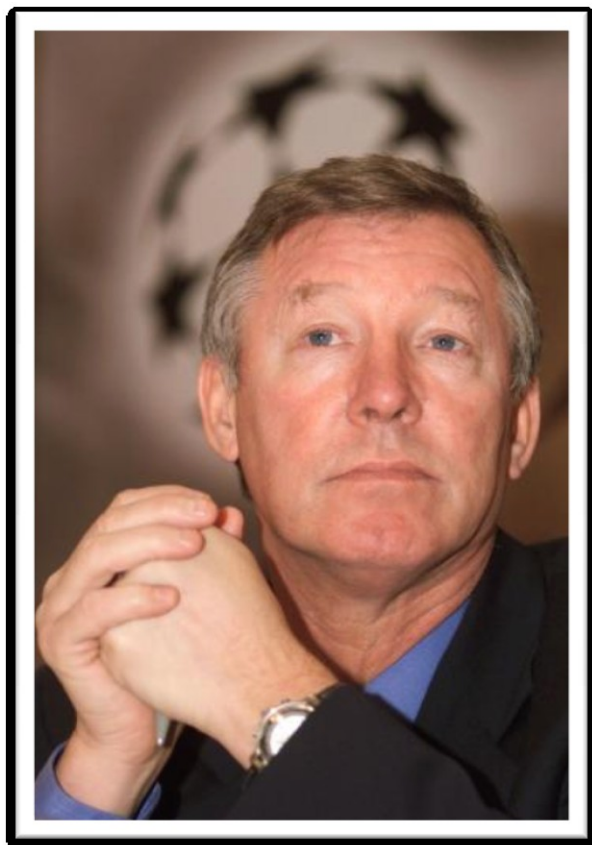
Sir Alex Ferguson

„Děti dnes nemají čas samy na sebe, na to, aby trávily čas se svými kamarády a jen hrály, procvičovaly a učily se.“