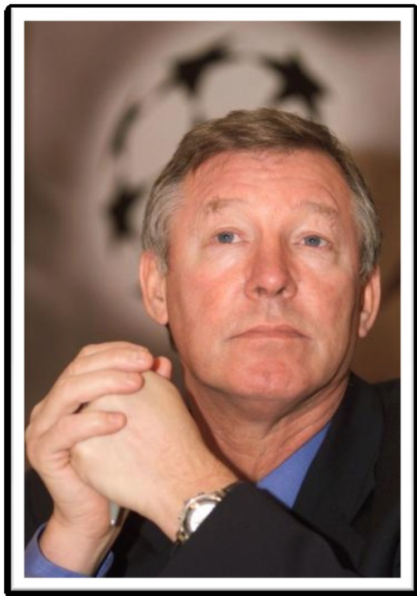
Sir Alex Ferguson

„Naučte děti, jak rychle to jen půjde, etickému přístupu a chování ve sportu.“